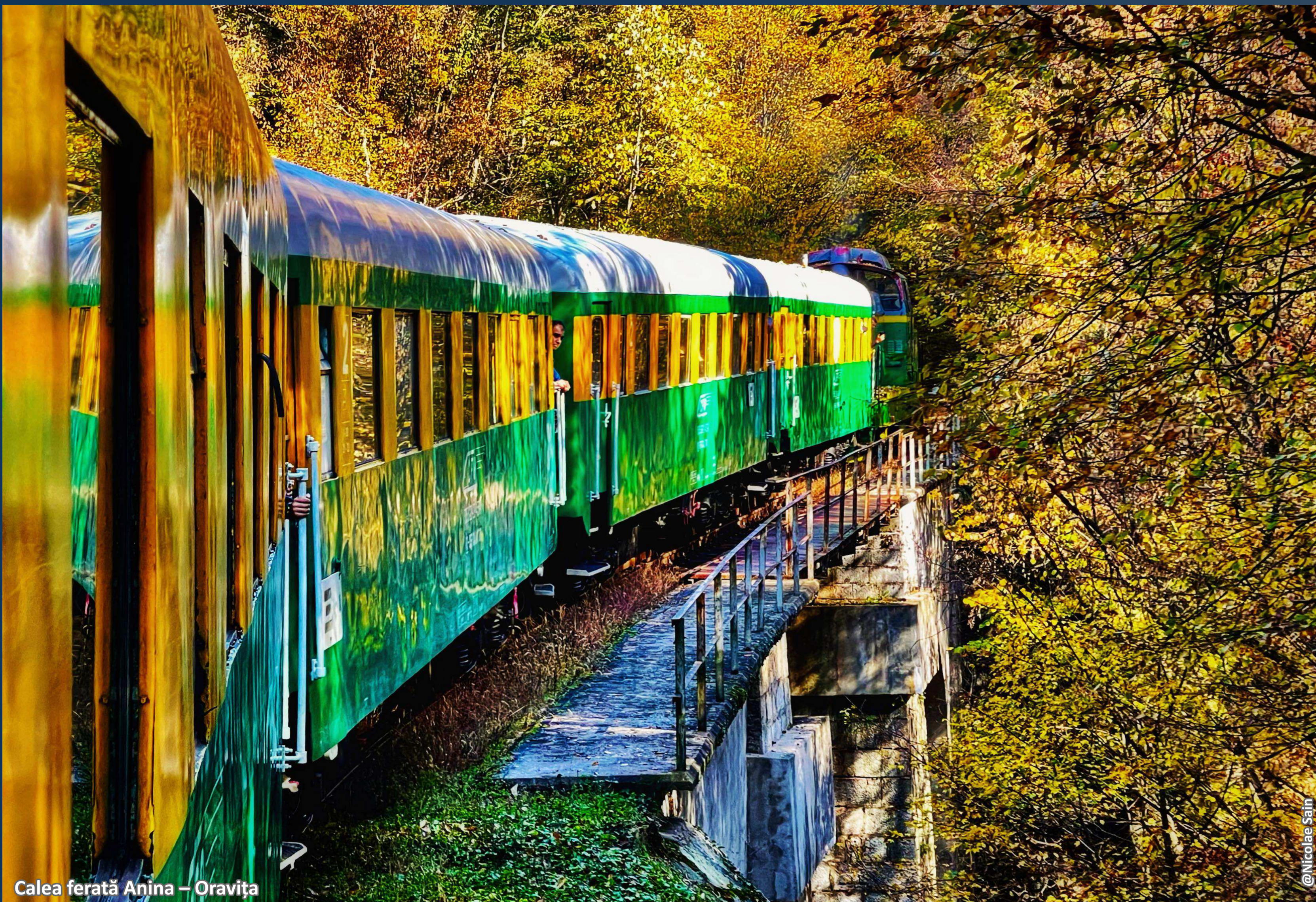
Calea ferată Anina – Oravița

A fost o dată ca niciodată un colț de rai. Cu păduri bogate, ape curate și tot felul de animale și păsări măiestre, unele nemaivăzute prin alte zone ale țării sau chiar prin lumea întreagă.