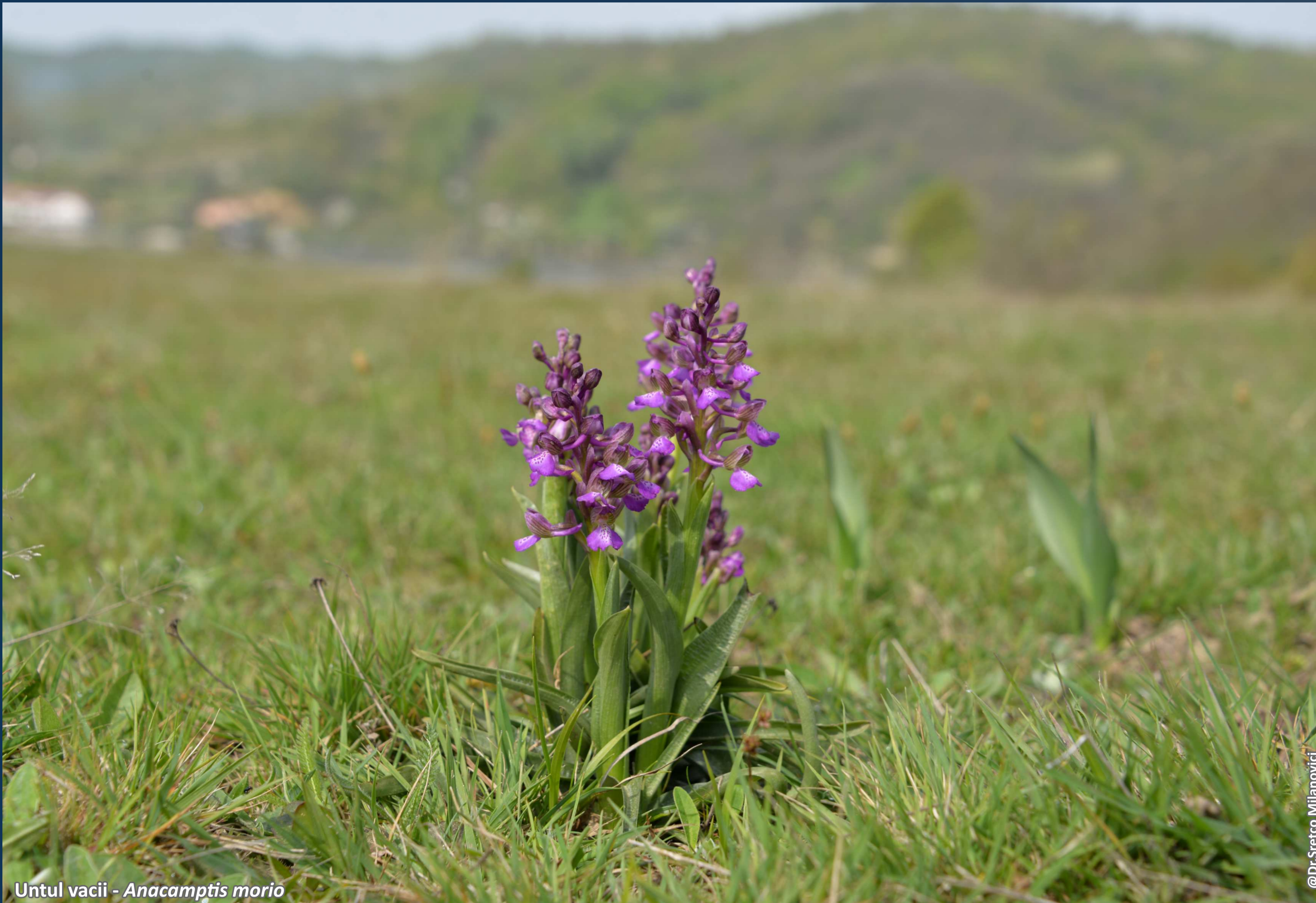
Untul vacii - Anacamptis morio

A fost o dată ca niciodată un colț de rai. Cu păduri bogate, ape curate și tot felul de animale și păsări măiestre, unele nemaivăzute prin alte zone ale țării sau chiar prin lumea întreagă.