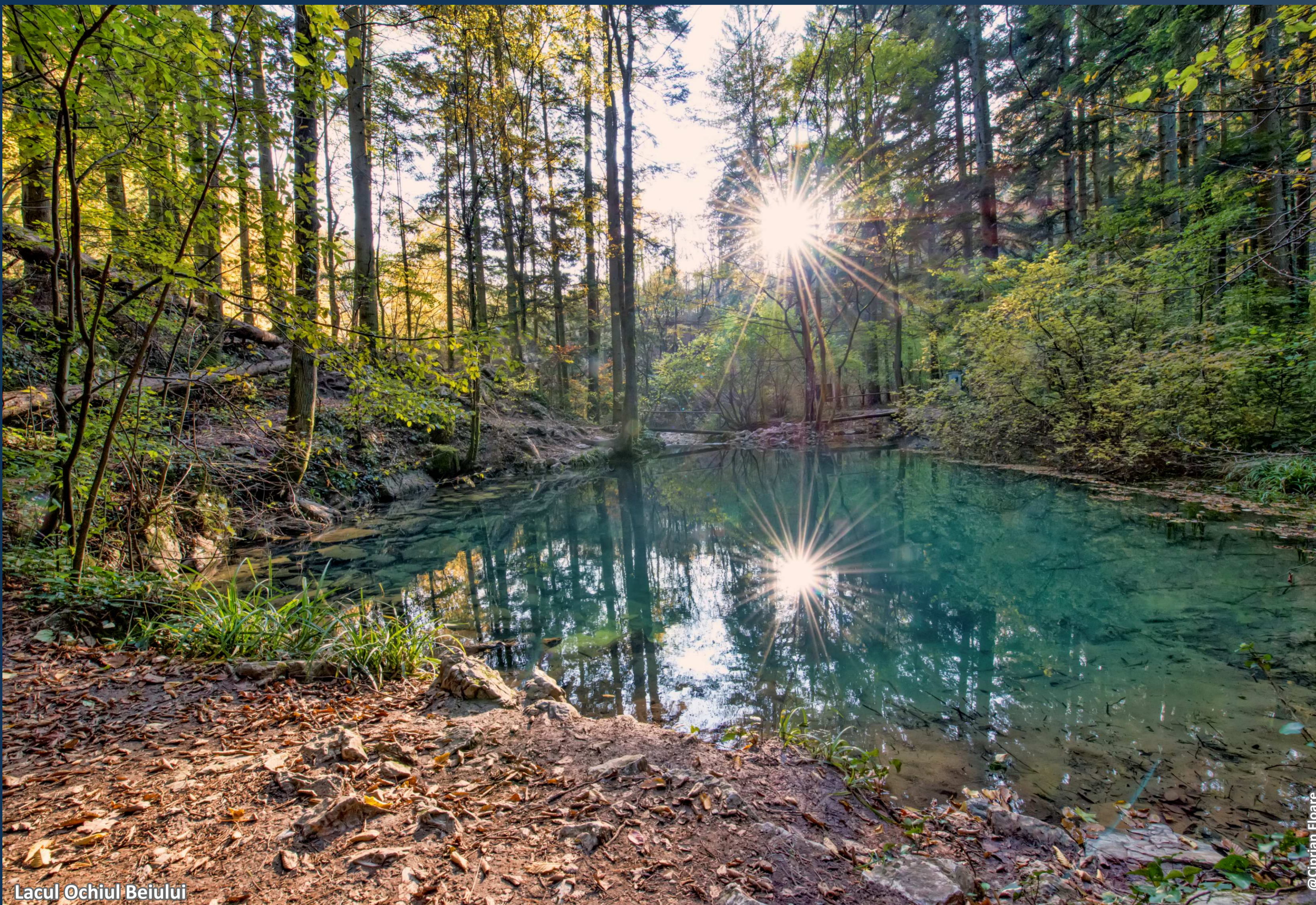
Lacul Ochiul Beiului