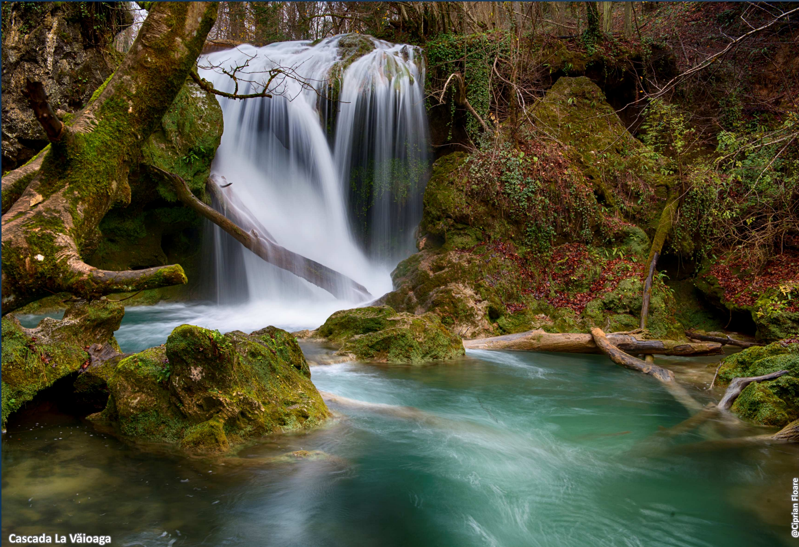
Cascada La Văioaga