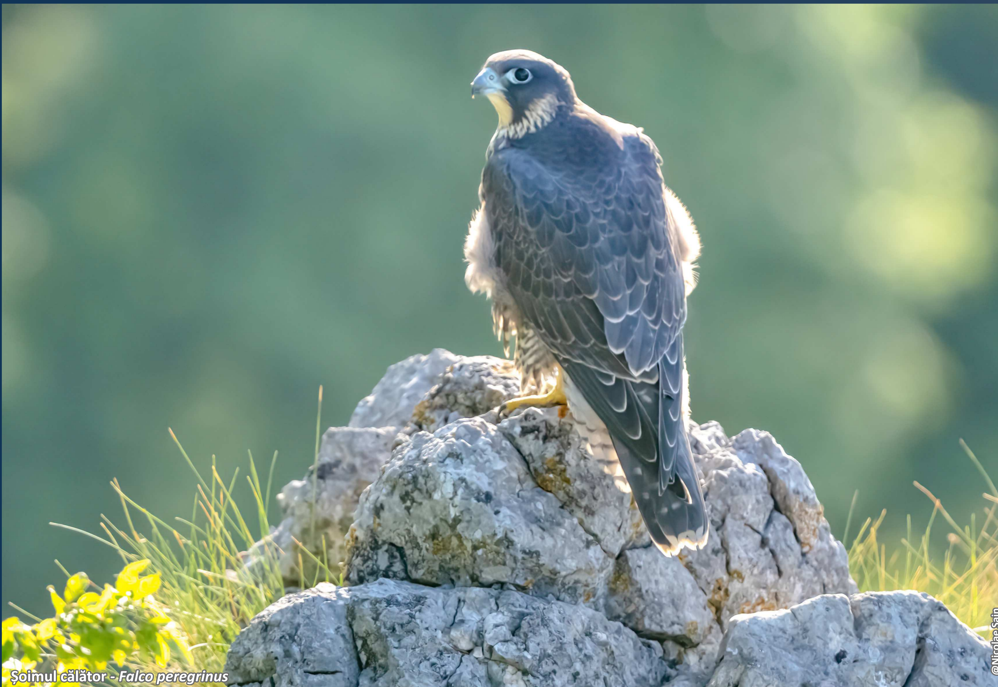
Șoimul călător - Falco peregrinus