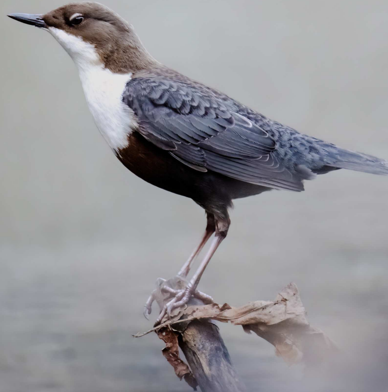
Mierla de apă - Cinclus cinclus

A fost o dată ca niciodată un colț de rai. Cu păduri bogate, ape curate și tot felul de animale și păsări măiestre, unele nemaivăzute prin alte zone ale țării sau chiar prin lumea întreagă.