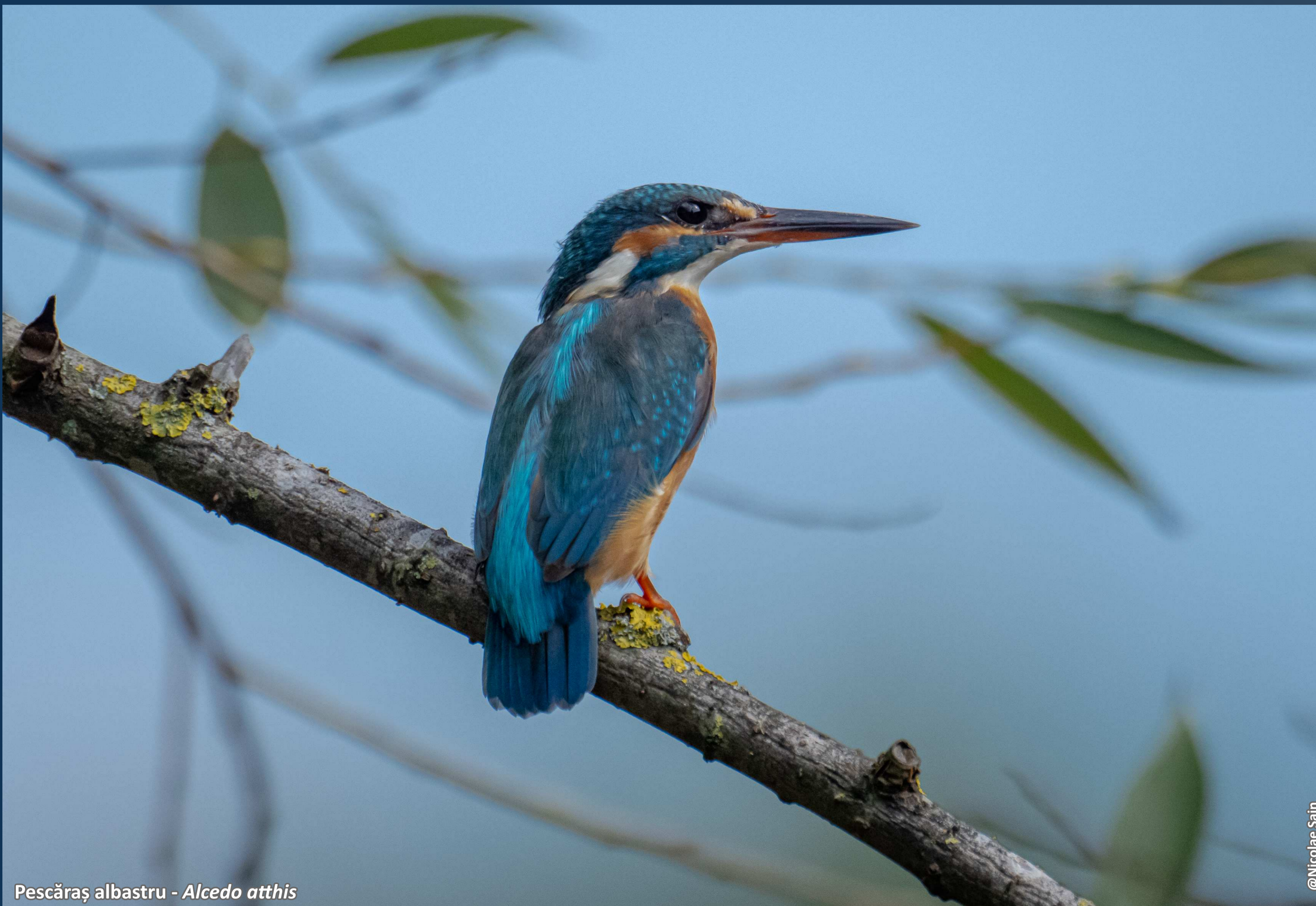
Pescăraș albastru - Alcedo atthis