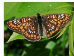
Marmoratul frasinului ( Euphydryas maturna )