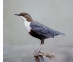
Mierla de apă ( Cinclus cinclus )