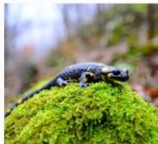
Salamandă ( Salamandra salamandra )