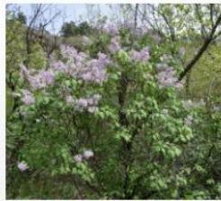
Liliac ( Syringa vulgaris )