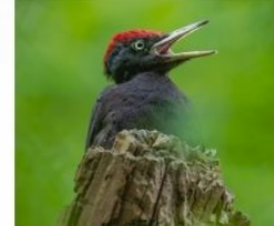
Ciocănițoarea neagră ( Dryocopus martius )

Farmecul deosebit al acestei zone este dat și de Cheile Nerei care, împreună cu numeroasele izvoare petrifiante cu formare de travertin, dau naștere unor cascade impresionante și unor lacuri naturale incredibil de frumoase.