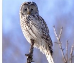
Huhurezul mare ( Strix uralensis )