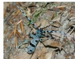
Croitorul fagului ( Rosalia alpina )