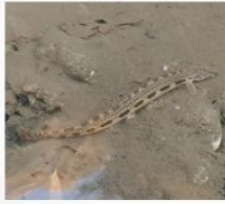
Fâsa mare ( Cobitis elongata )