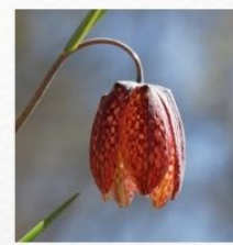
Laleaua peștriță ( Fritillaria montana )