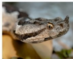
Vipera cu corn ( Vipera ammodytes )

Teritoriul parcului este un adevărat paradis pentru numeroase specii de insecte, păsări și mamifere. Cursurile de apă sunt bogate în pești, iar existența peisajului carstic (tip de peisaj compus din roci calcaroase) și a unui climat cu un pregnant caracter submediteranean, face posibilă și observarea unor specii, cum ar fi scorpionul carpatin sau vipera cu corn.