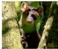
Ider de copac ( Martes martes )