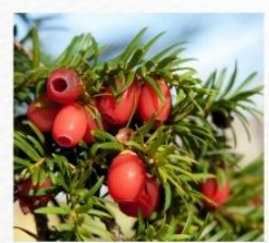
Tisă ( Taxus baccata )