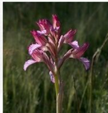
Gemănarița ( Anacamptis papilionacea )

Știați că aici pot fi întâlnite peste jumătate din speciile de orhidee spontane din România?