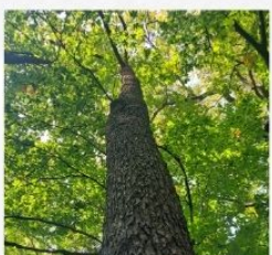
Alun turcesc ( Corylus colurna )