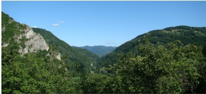
Vedere de ansamblu componenta UNESCO