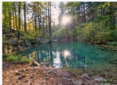
Lacul Ochiul Bei

Farmecul deosebit al acestei zone este dat și de Cheile Nerei care, împreună cu numeroasele izvoare petrifiante cu formare de travertin, dau naștere unor cascade impresionante și unor lacuri naturale incredibil de frumoase.